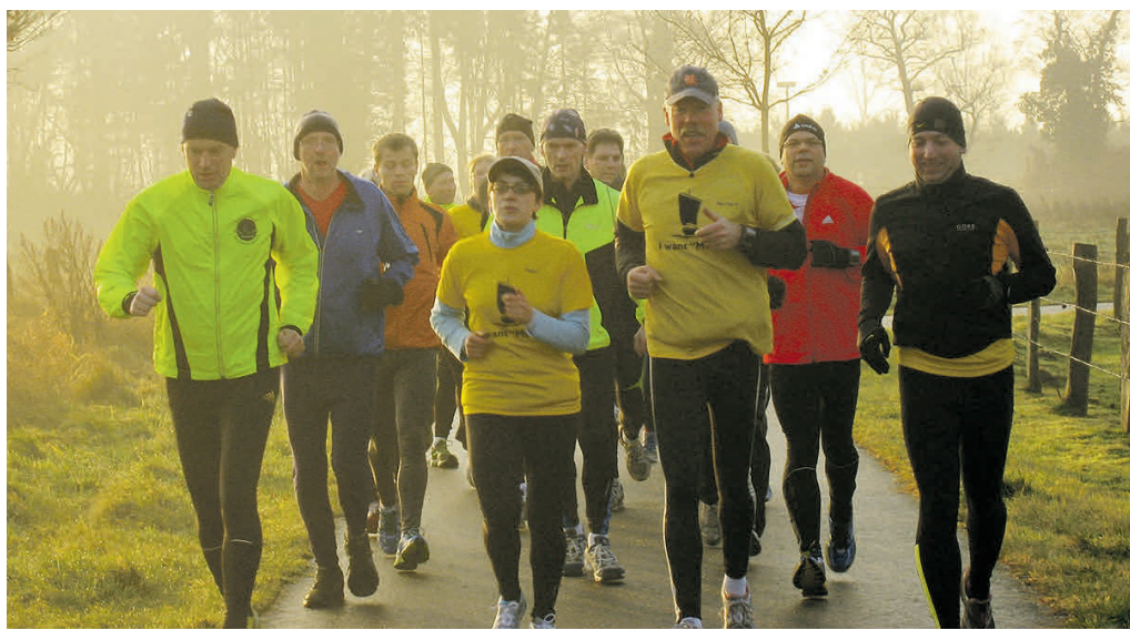
Rund um den Butenpad führte die Laufstrecke der Silvesterläufer.