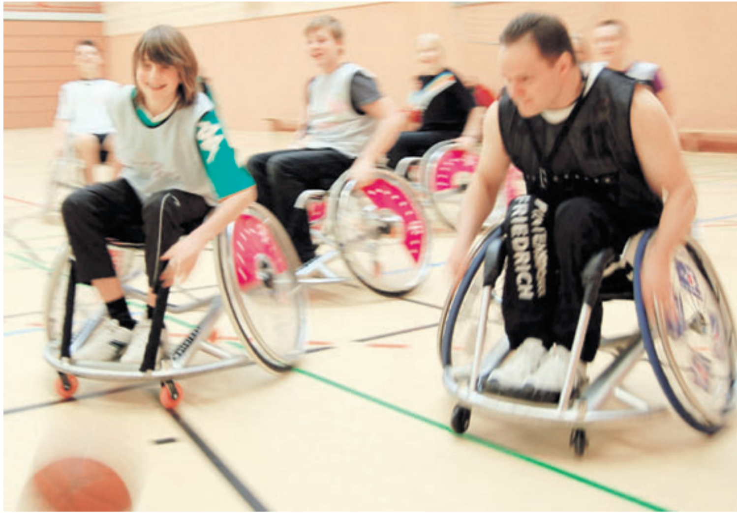
Temporeich: Rollstuhl-Basketball, hier beim gestrigen Unterricht in Ritterhude. Am dortigen Schulzentrum Moormannskamp machten Mitarbeiter des Förderprojekts „Neue Sporterfahrung“ Station und stellten die Sportarten „Goalball“ und Rollstuhl-Basketball vor.

Bei der paralympischen Disziplin „Goalball“ handelt es sich übrigens um ein ursprünglich für Sehbehinderte entwickeltes Spiel. Ziel dabei ist es, allein über das Gehör und den Tastsinn einen – mit Rasseln versehenen – Ball ins gegnerische Tor zu befördern und das eigene Gehäuse zu verteidigen. Eine keineswegs leichte Aufgabe, wie die Ritterhuder Schüler etwa der Klasse 7 R 1 feststellen konnten. Seite 5